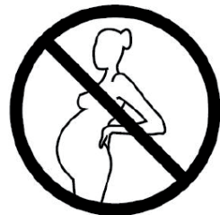
Do not take when pregnant

Gefördert von der Senatsverwaltung für Gesundheit, Pflege und Gleichstellung.